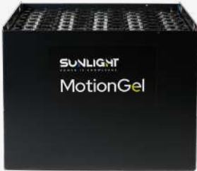
Funcionamiento de la batería

Con Sunlight Knowi, el BMS inteligente, consigues tener el control total del rendimiento de la batería y el montacargas