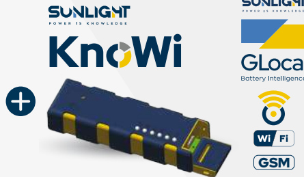
Captura de datos a través del BMS para ser almacenados en el Sunlight GLocal