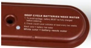
Señal del indicador de agua

El sistema de agregado de agua HydroLink de Trojan está específicamente diseñado para funcionar con baterías de electrolito líquido Trojan de 6 voltios y 12 voltios* y evita las conjeturas acerca del correcto agregado de agua a las baterías de electrolito líquido. Con una sencilla instalación de las ventilaciones HydroLink y las tuberías, el sistema está listo para usar. Una vez instalado, puede llenarse un conjunto completo de baterías en menos de 30 segundos.