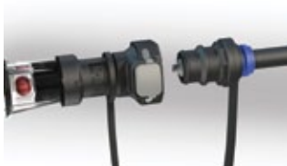
Conexión de la unión con indicador de flujo de agua

El sistema HydroLink está equipado con supresores de llama dobles, una característica de seguridad importante que no es estándar en otros sistemas de agregado de agua. Los supresores de llama internos evitan que las chispas internas pasen a través del sistema de agregado de agua a las celdas vecinas, mientras que el supresor de llama externo evita que las chispas externas ingresen a la batería Trojan.