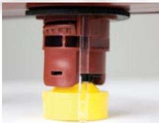
Indicador del nivel de agua independiente

El mantenimiento apropiado y el agregado periódico de agua son factores importantes para maximizar el desempeño y la vida de las baterías de electrolito líquido de ciclo profundo de Trojan. El mantenimiento de la batería puede ser un trabajo caro, sucio y consumidor de tiempo. Con el sistema avanzado de agregado de agua de punto único HydroLink™ de Trojan, el agregado de agua preciso de la batería se realiza fácilmente y le permite ahorrar tiempo y dinero.