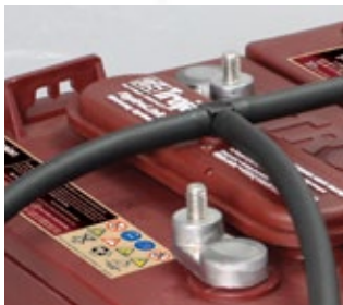
Tuberías sin abrazaderas

Mantener el nivel de electrolito correcto puede prolongar el desempeño y la vida de las baterías de electrolito líquido Trojan. No obstante, determinar el nivel adecuado puede representar un desafío. La ventilación HydroLink de Trojan posee un indicador del nivel de agua independiente que muestra de manera precisa si la batería necesita o no agua. Un indicador blanco señala que la batería necesita agua. Un indicador negro señala que la batería tiene agua suficiente... ¡Así de sencillo!